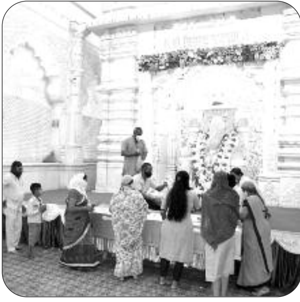
काल अंगारकी चतुर्थीनिमित्त शहराचे ग्रामदैवत श्री विशाल गणेश मंदिर येथे भाविकांना सुरक्षित अंतर ठेवून दर्शनासाठी प्रवेश दिला जात होता.